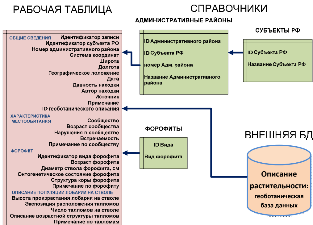
Рис. 1. Структура базы данных по распространению лобарии легочной.

Общие сведения о находке включают в себя сведения о географической привязке, которая возможна с разной степенью точности: на уровне субъекта РФ, административного района субъекта, или же географических координат. Здесь же указывается автор находки или ссылка на литературный источник, а также дата находки. Эти данные в дальнейшем используются при визуализации информации на интерактивной карте. Характеристика местообитания включает в себя краткую информацию о составе лесного сообщества (название по доминантной классификации, возраст, тип и давность нарушений), а также информацию о встречаемости лобарии в данном лесном массиве. При наличии подробного (геоботанического) описания сообщества или перечня видов растений, через пользовательское приложение можно подключиться к внешней базе с геоботаническими данными и внести информацию. Дерево-форофит характеризуется следующими параметрами: вид, возраст, диаметр ствола на высоте 130 см, онтогенетическое состояние, структура коры. Субпопуляция лобарии на стволе может быть описана следующим образом: высота произрастания талломов, экспозиция, число талломов на стволе.